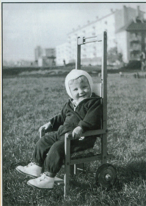
Zgrada u Čakovečkoj i D. P. u kolicima (kotači su poslije iskorišteni za romobil)