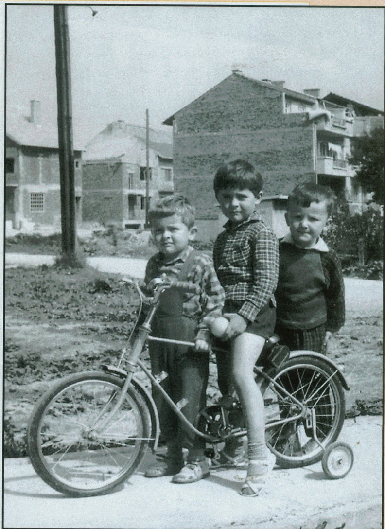
Društvo s biciklom u Martijanečkoj ulici

Naličje Čakovečke, Krapinska ulica, bila je vrlo neugledna, ružna, prljava, tvornička ulica, na čije su tratine stanovnici »Čakovečke« uredno bacali razne otpatke. I nismo se jednom nakon nogometa vraćali okrvavljenih koljena zbog stakala razbijenih boca koja su se godinama gomilala u jarcima s obje strane ulice. Stanovnici kvarta